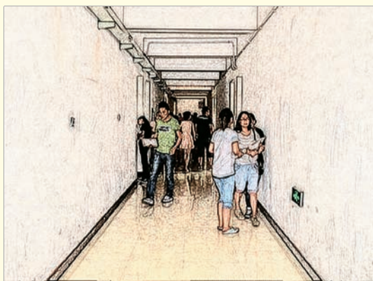
——“我们下节课在哪个教室?” ——“104教室,快走!占座儿去!”

“你问我几时能一起回去,看看我们的宿舍我们的过去,你刻在墙上的字依然清晰,从那时候起,就没有人能擦去。” ——《睡在我上铺的兄弟》