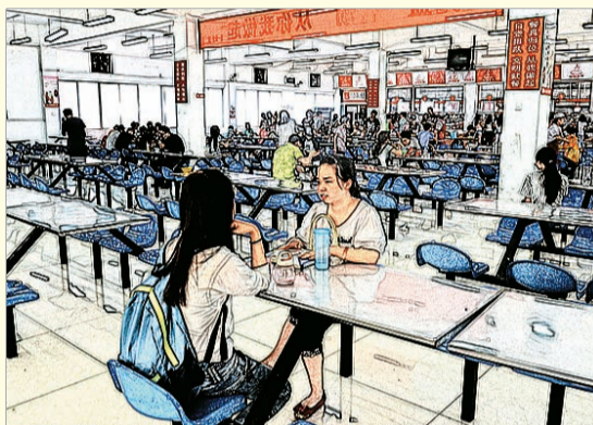
——“吃什么呀?最头疼这个问题了。” ——“我决定吃一大份牛肉拉面!” ——“大份!说好的减肥呢?”